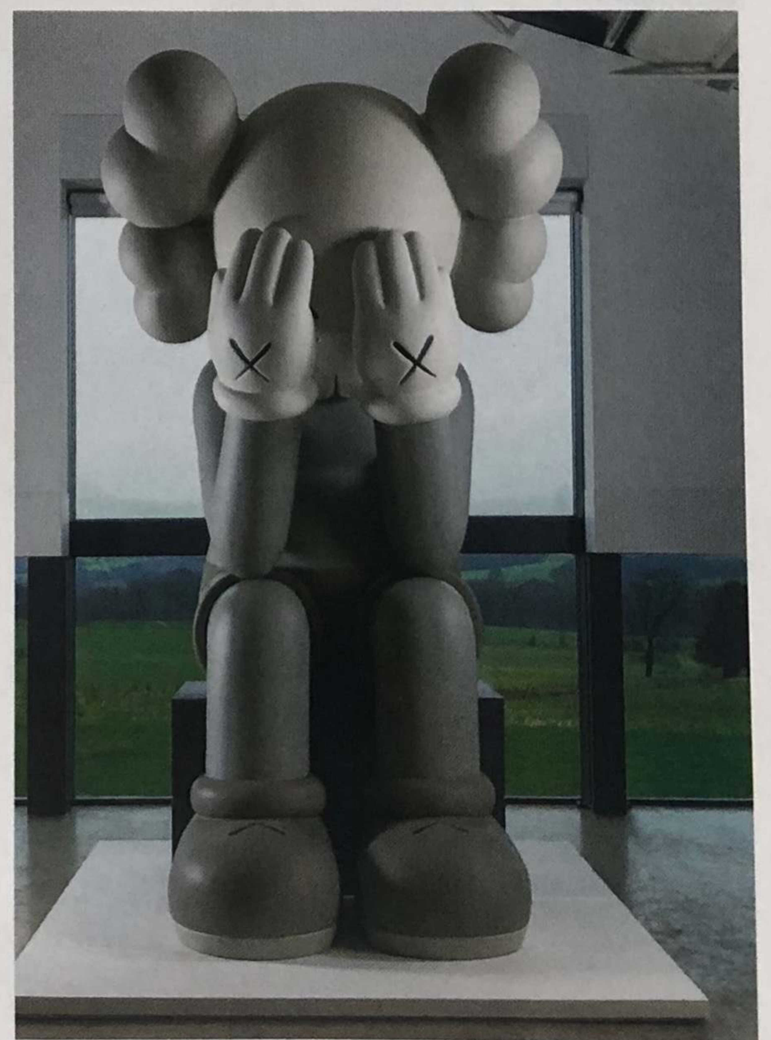
KAWS - Passing through 2010 - Collection of Larry Warsh