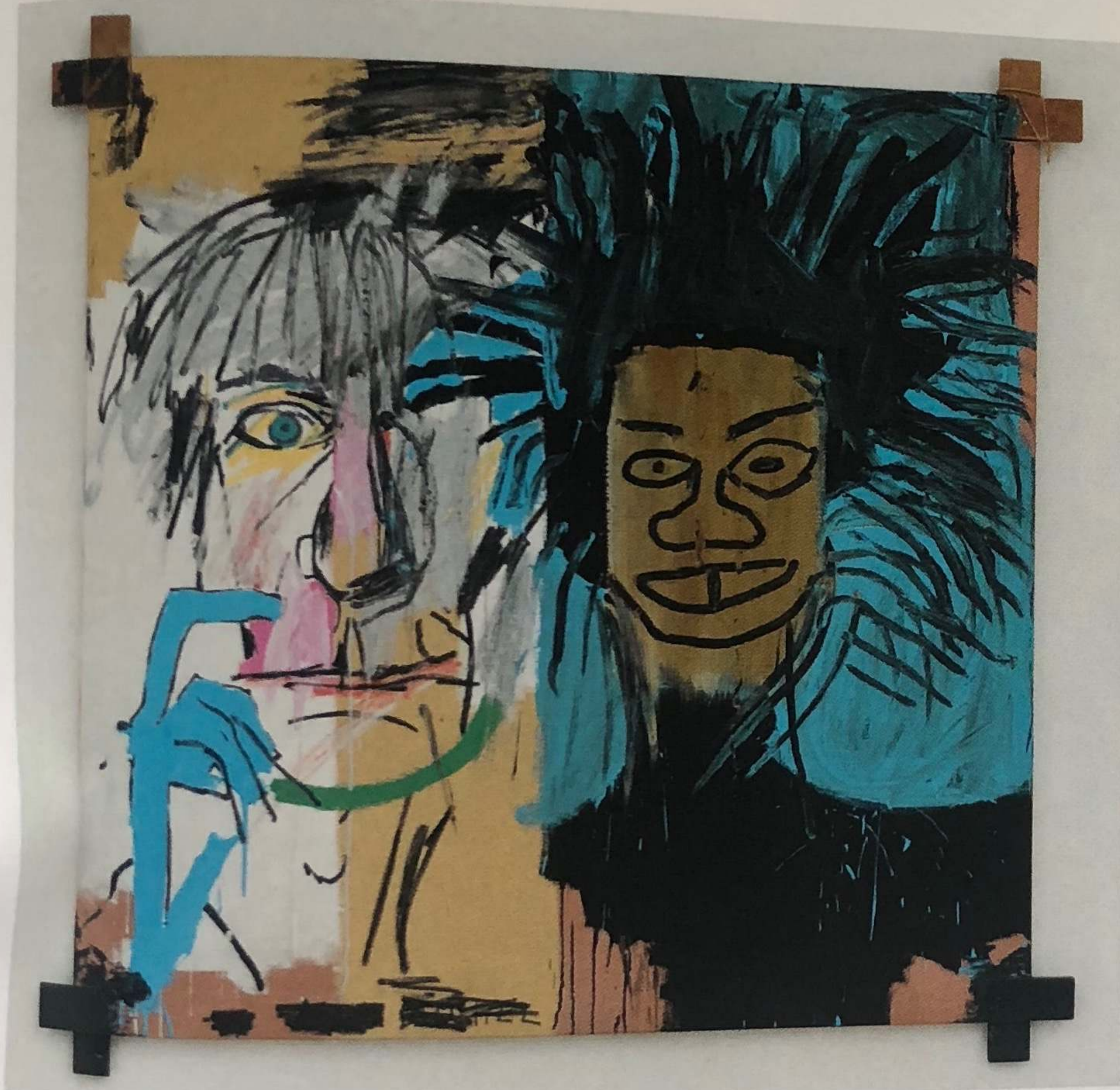
JEAN-MICHEL BASQUIAT - Dos Cabezas - 1982 - Acrylique