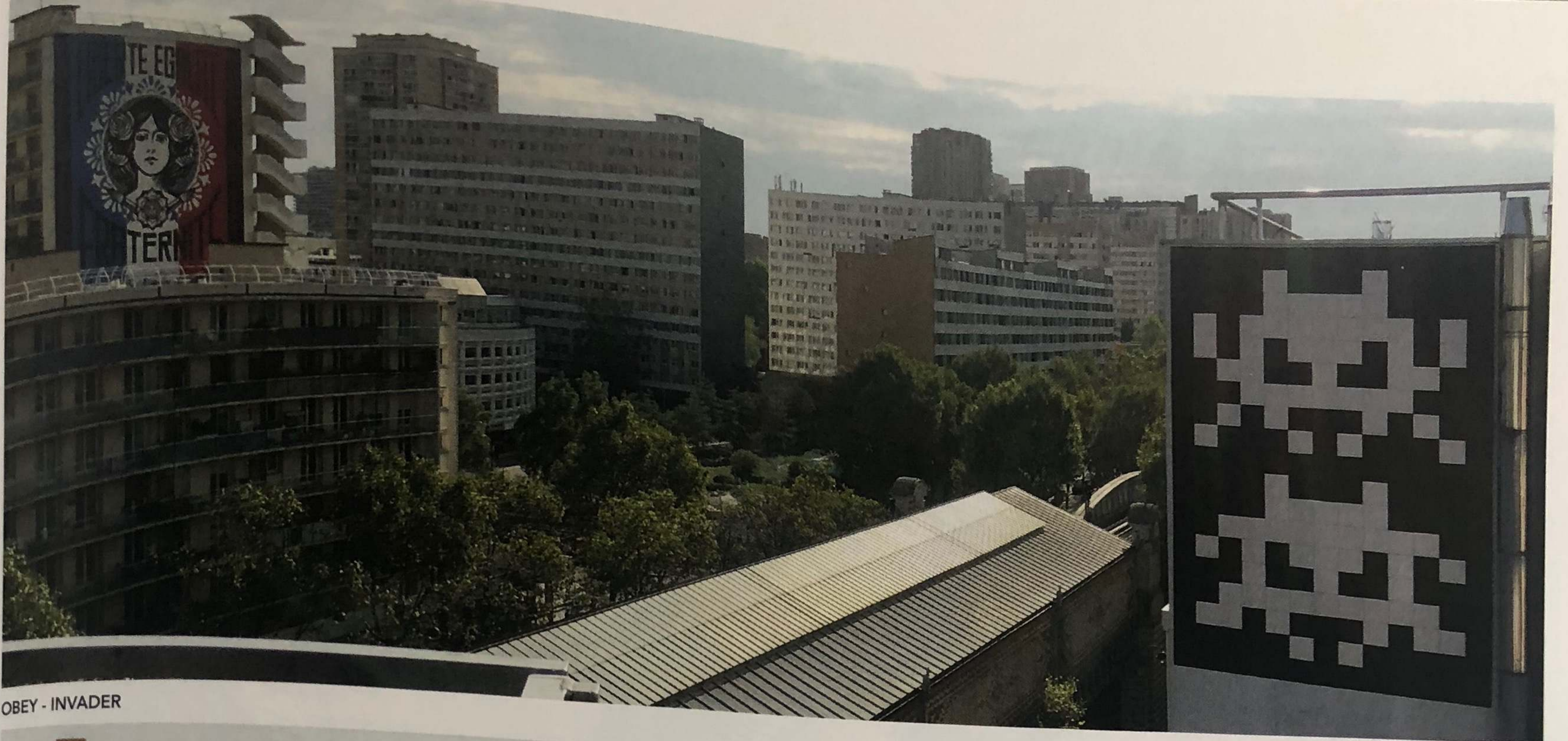
OBEY - INVADER