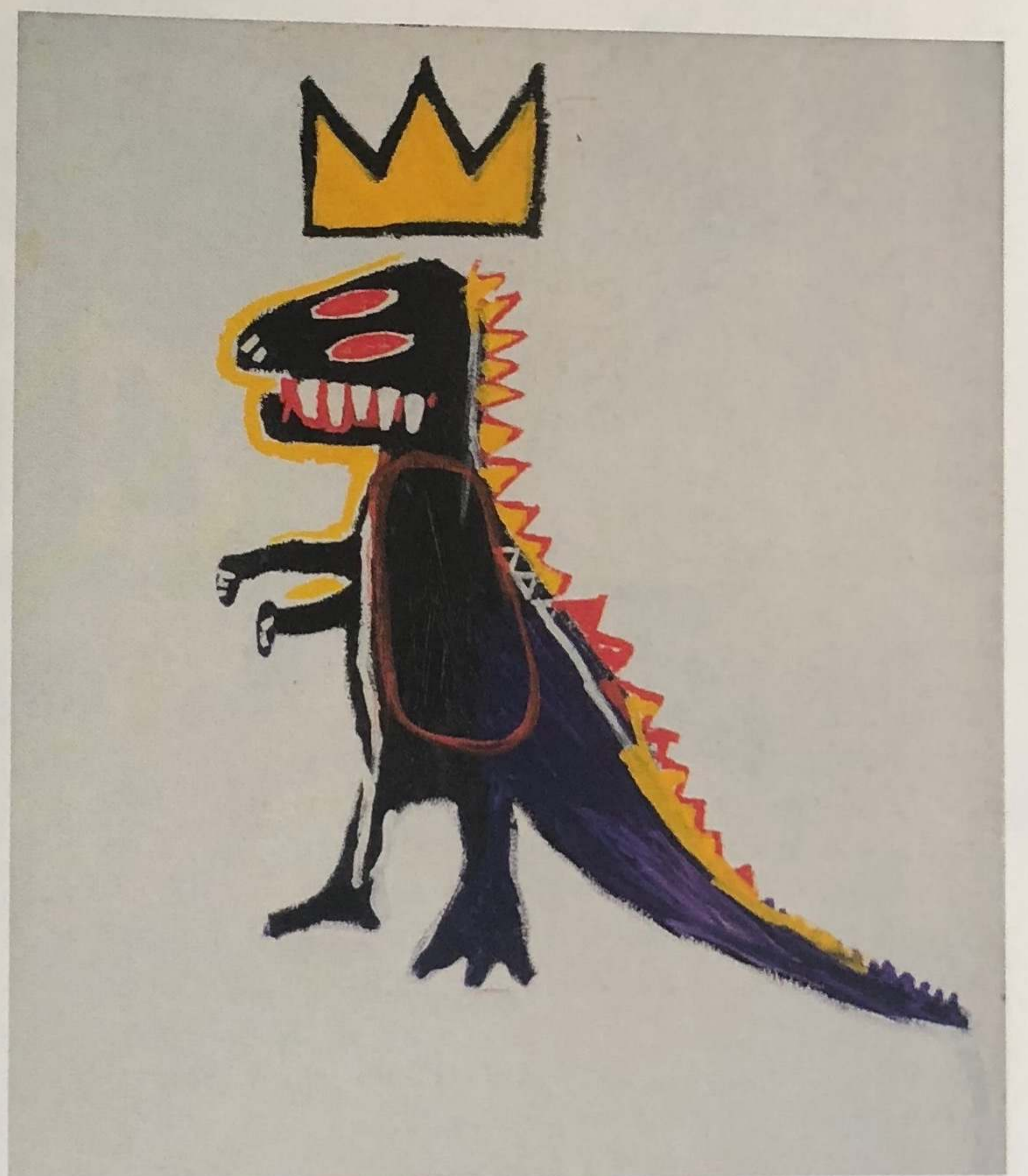
JEAN-MICHEL BASQUIAT - Pez Dispenser - 1984 - Acrylique