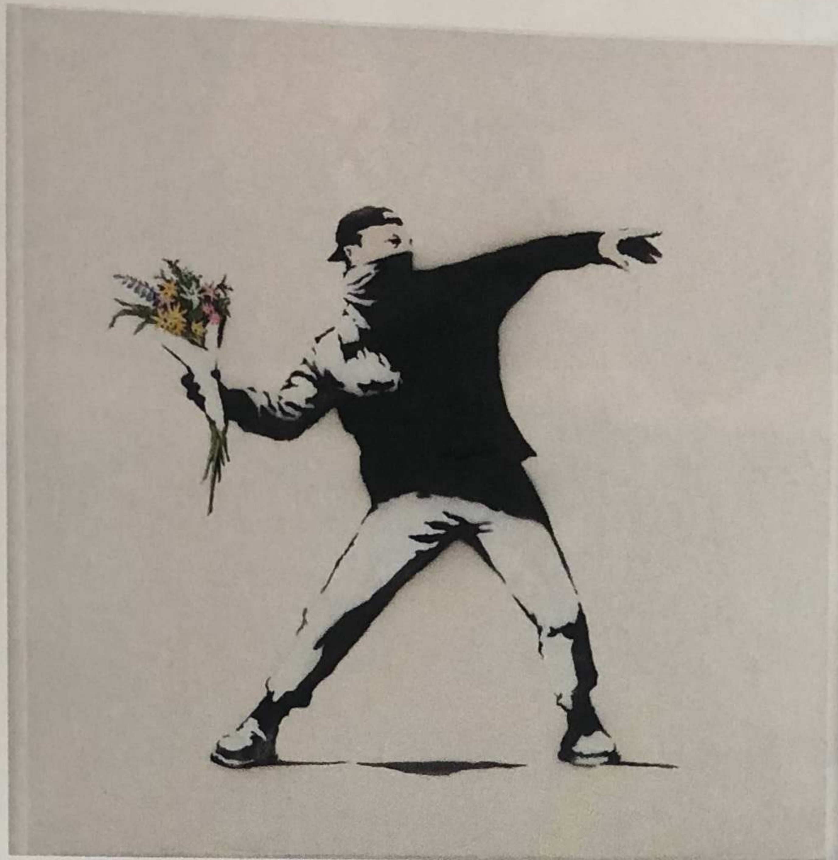
BANKSY - Love is in the Air (2005), Courtesy the artist and Lazinc