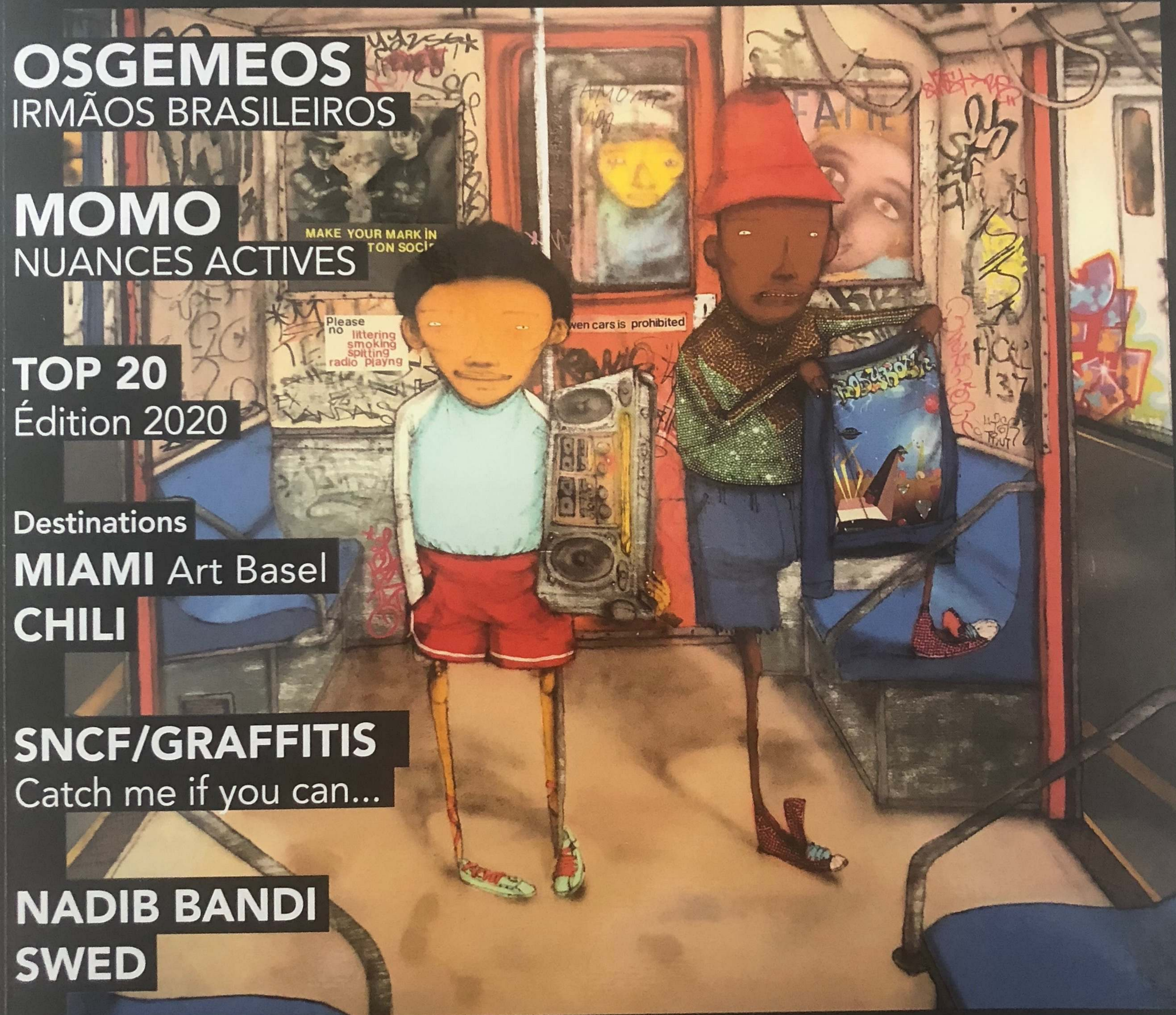
OS GEMEOS - Train ©2019 Nashville by Valentin