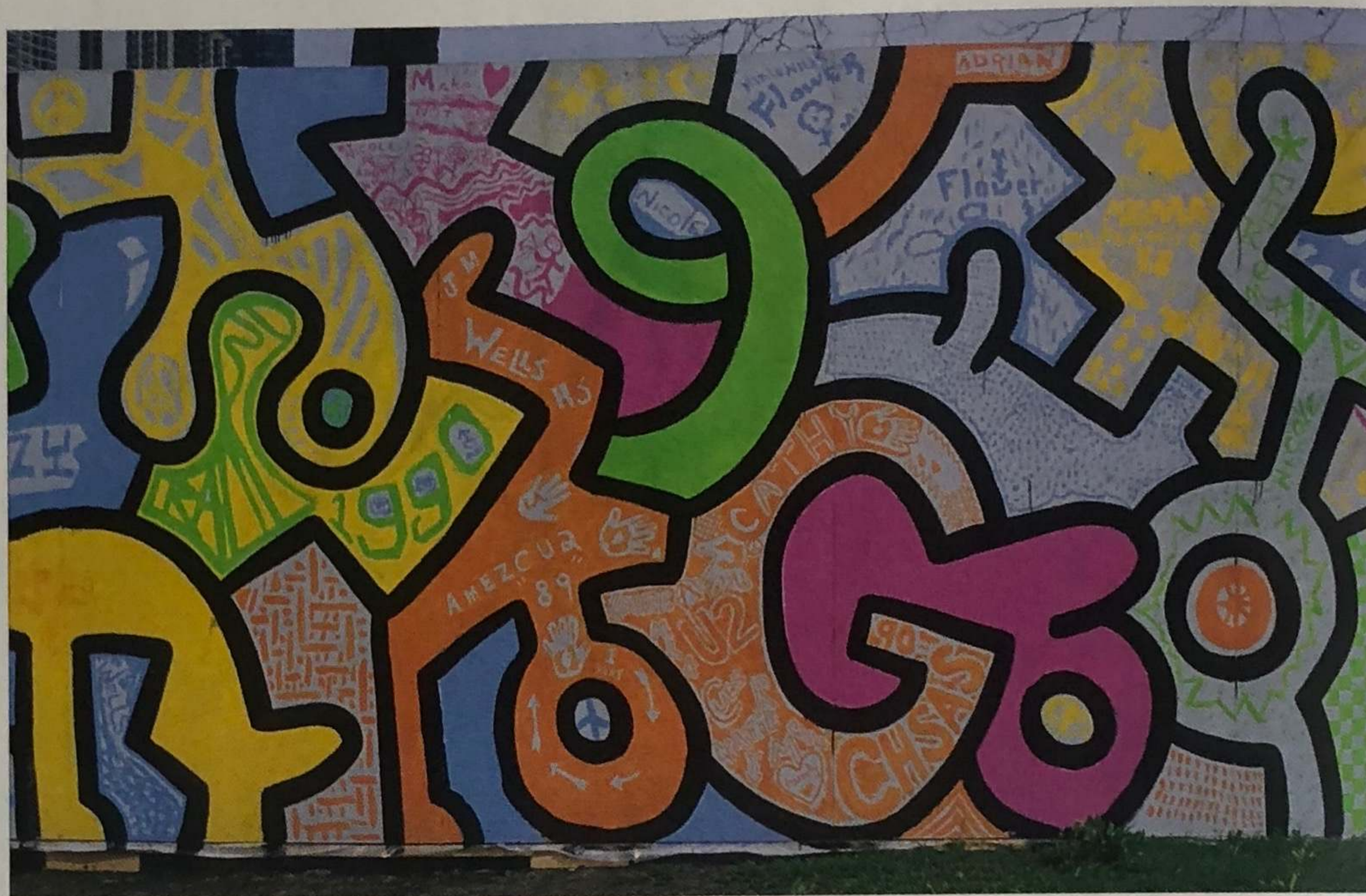
KEITH HARING - CPS2

20, c'est le chiffre symbolique de cette nouvelle année et nouvelle édition de Stuart. C'est aussi un nombre tombant à pic, et l'exact et parfait timing pour mener l'enquête sur les 20 « Most Wanted » street artistes dont certains, au moment même ou nous écrivons ces quelques lignes, font trembler les murs de la planète ! In extenso , au rythme effréné des feux des projecteurs urbains, qui sont ces nouveaux artificiers aussi sourcilieux que des horlogers suisses, à la mégalomanie expressive, nourrissant notre appétit pantagruélique pour leurs moindre faits et gestes ?