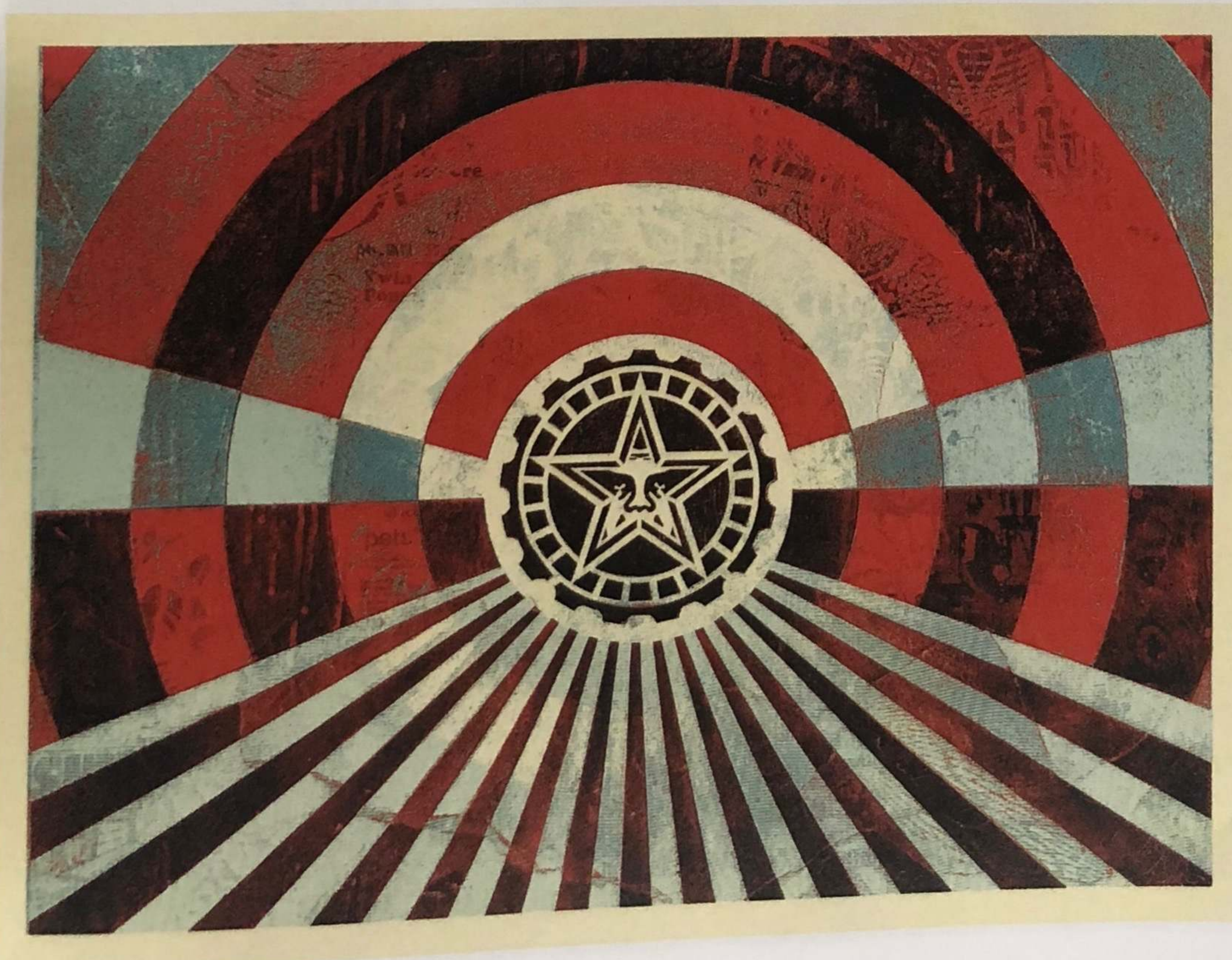
OBEY - Tunnel Vision (BLUE) 18X24